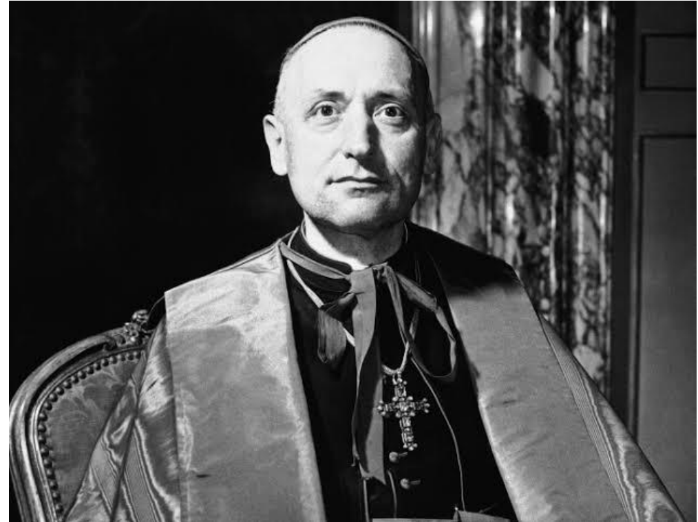
Mindszenty József 1946-ban