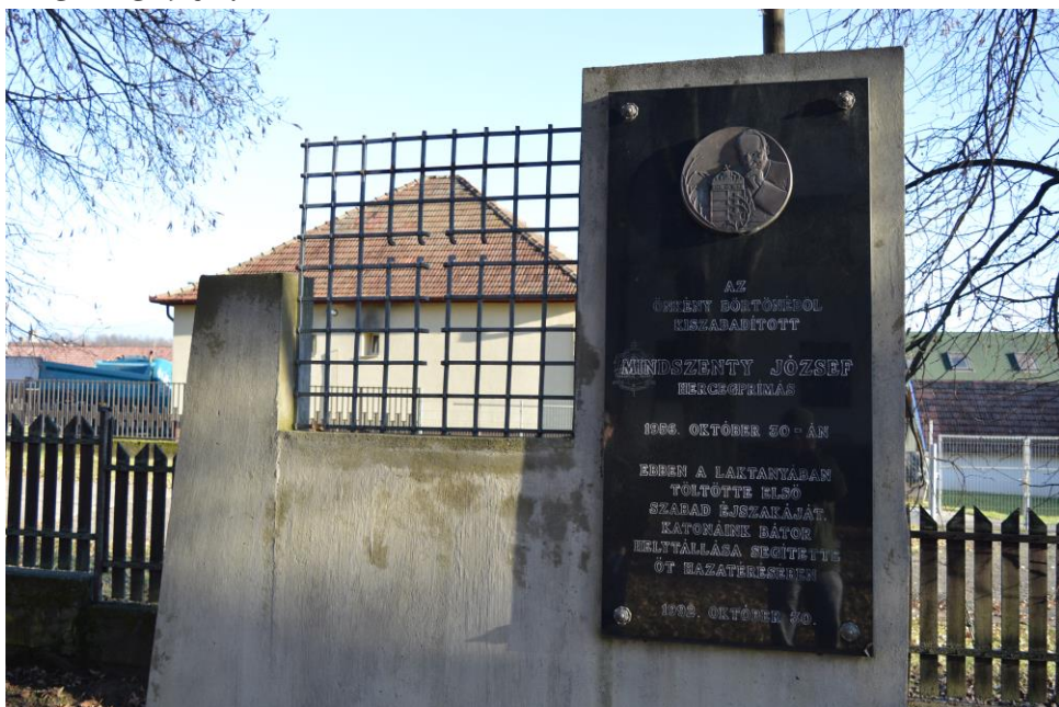
Mindszenty-emlékfal a rétsági laktanyában