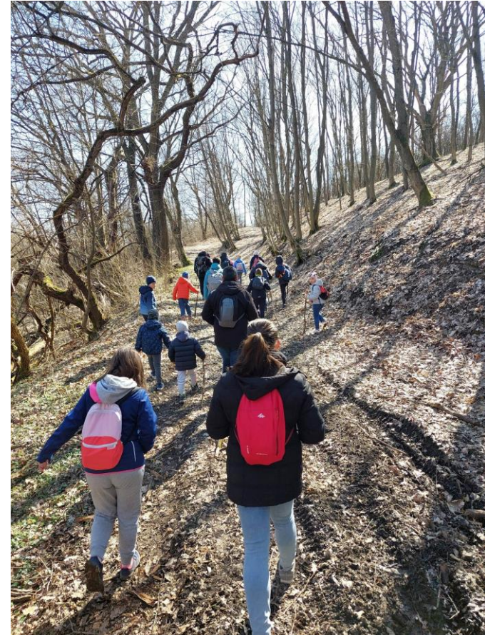
Mindszenty nyomában túrázó gyerekek és szülei