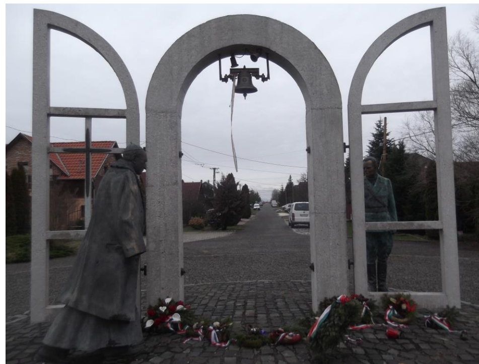
Mindszenty-Pallavicini emlékmű Rétságon